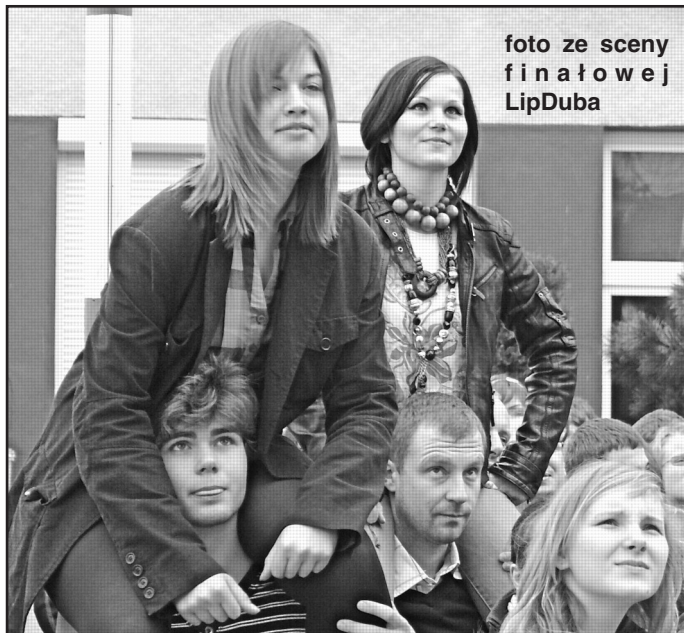
foto ze sceny finałowej LipDuba